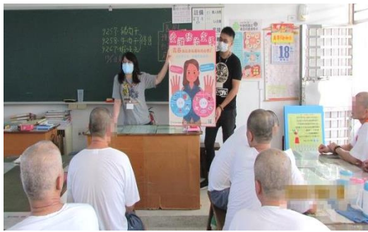
衛生所醫護人員到各工場 做 HIV/AIDS 傳染病衛教宣導