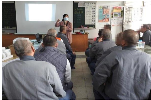
成大醫院愛滋專案個管師至工場 做 HIV/AIDS 傳染病衛教宣導