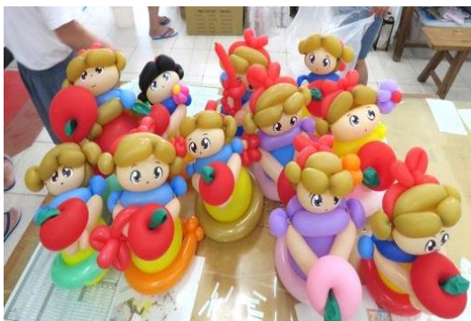
創意氣球學習的作品~可愛又美麗