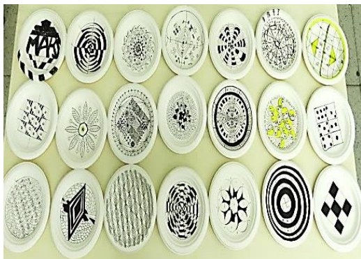
學習放下你我心中的~「糾結」禪繞畫