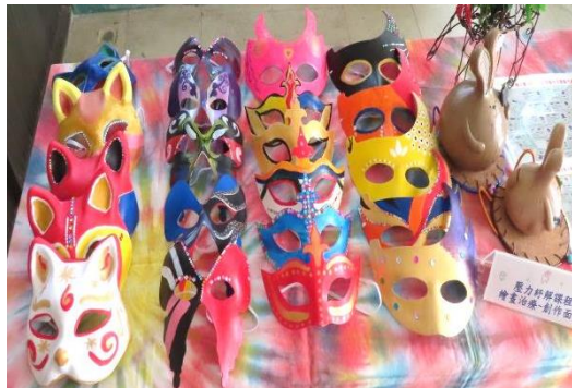
面具~畫出自我內心的交戰