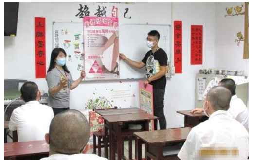
衛生所醫護人員到少觀所 對青少年做 HIV/AIDS 傳染病衛教宣導