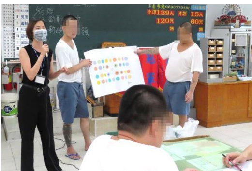
衛生所醫護人員會到本監各工場 做 HIV/AIDS 傳染病衛教宣導