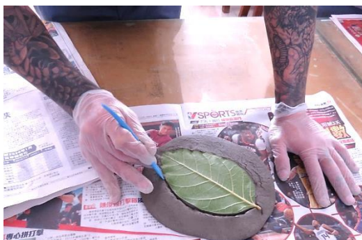
葉拓體驗~以前的你/現在的你 (刺青的手/藝術的手)