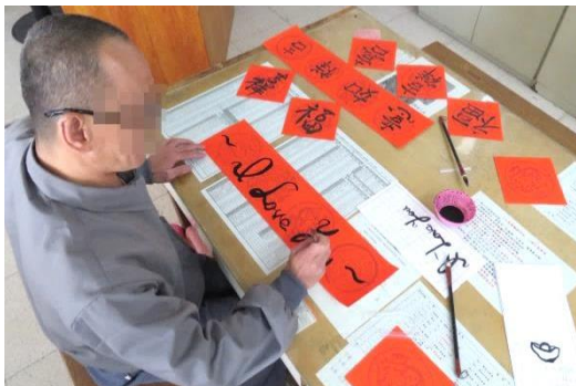
彩虹技訓班課程豐富~團體心理輔導 寫春聯~一解過年時的鄉愁