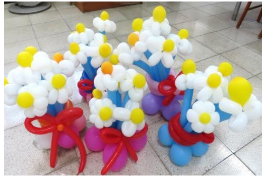
創意氣球學習的成品~簡單/清新的花兒