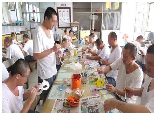
製作各式繪圖卡紓解壓力