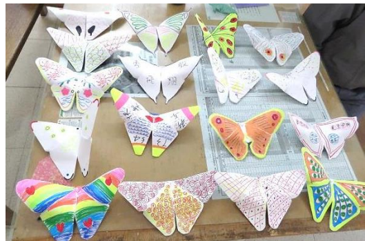
課程中學習到人際是可相互支持的 及生命經驗分享、正向鼓勵與肯定