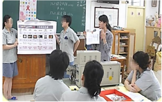
衛生所醫護人員到女所工場 對女受刑人做 HIV/AIDS 衛教知識宣導