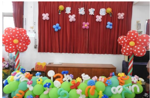
學員們在家庭日時所設計佈置的會場~ 大方可愛/令人難以忘懷