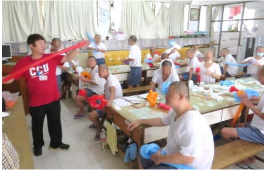
彩虹技訓班藝術治療~創意氣球課程 學員上課十分認真的學習