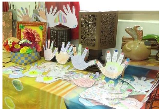
作品~家族關係圖&你我手牽手(手之頌)