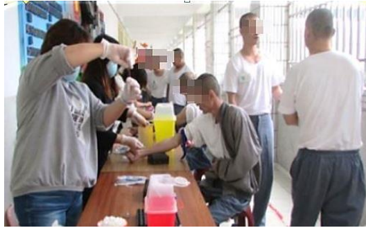
CD4 抽血檢驗由成大醫院雲林斗六分院感 染科醫療團隊入監診療後開立抽血檢驗單