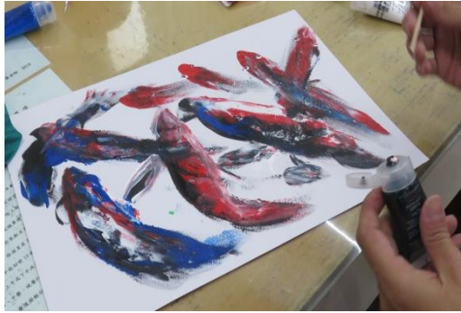
彩虹班壓力紓解課程很棒~ 氣球壓畫成藝術作品「九如圖」的呈現