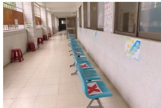
室外候診區做看診前的座位分流