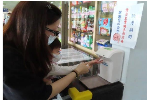
在接見室家屬隨時自主實施手部消毒