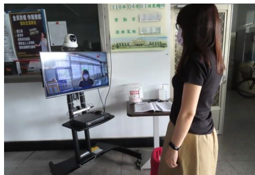
進入公共區域人員再次自動量測體溫