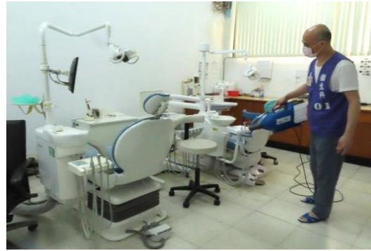
牙科診間做看診前、看診後的消毒