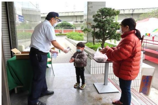
進出接見室家屬不管老人與小孩 均需消毒、量體溫、戴好口罩