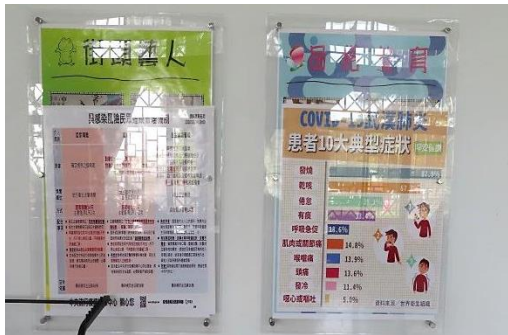
接見室牆上處處有海報宣導防疫