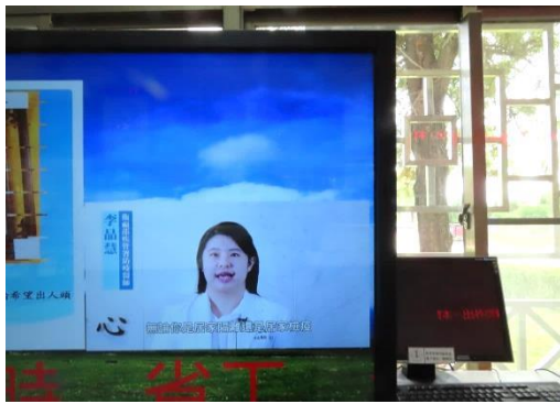
接見室服務台利用電子螢幕做防疫宣導