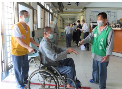
受刑人運動完回舍房前都需消毒