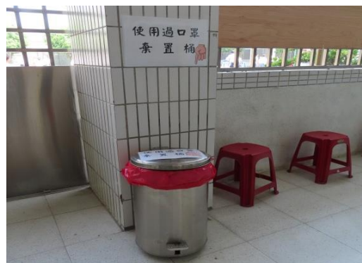
室外候診區特設~使用過口罩棄置桶