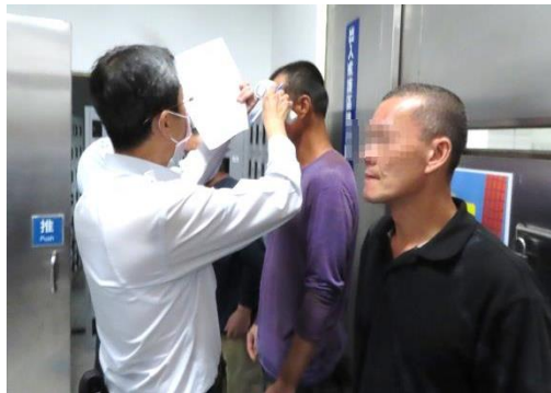
收容人自主作業返監入門時 量測體溫、消毒、換口罩