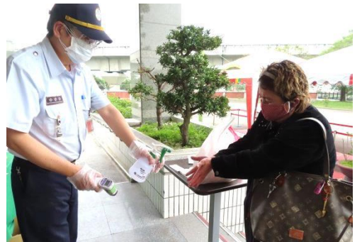
進出接見室所有家屬 做好消毒、量體溫、戴好口罩規定