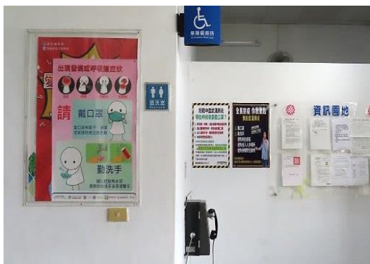
會客區域利用轉角牆上做防疫宣導