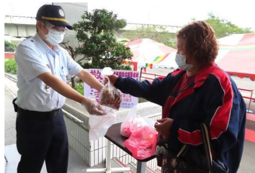
家屬帶的食物外袋均需更換以防感染