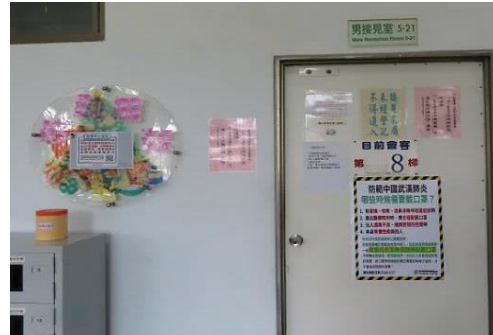
接見室前加強海報~宣導防疫