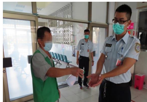
戒護人員執行任務返回中央台都需消毒