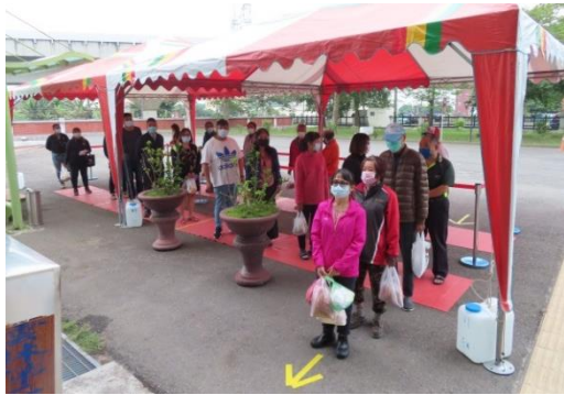
家屬有秩序的排隊等待會客接見