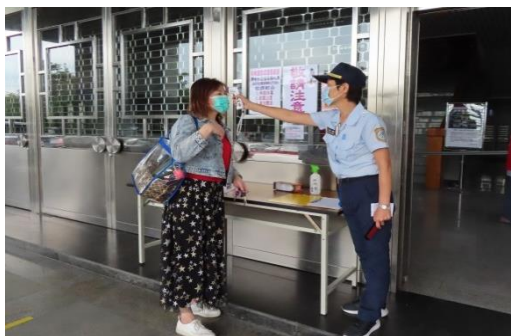
大樓門前的防疫措施~進出員工需填寫資料、消毒、量體溫、戴好口罩