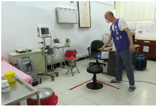
診間做看診前、看診後的消毒