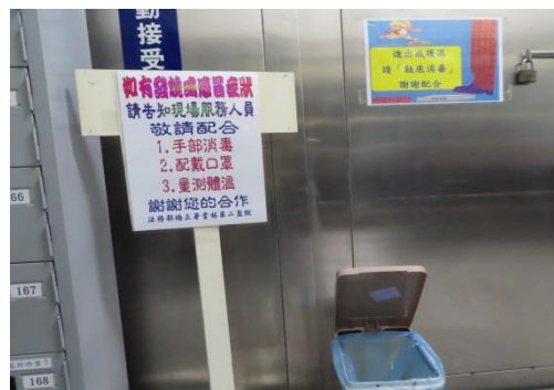
進入戒護區門前的提醒注意事項