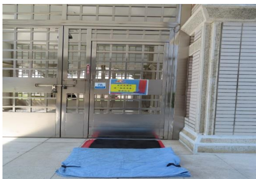
進入戒護區前的3道門設置消毒墊