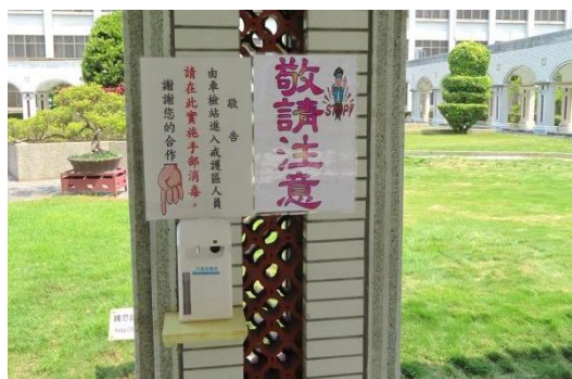
第3道門的自動感應噴灑酒精消毒