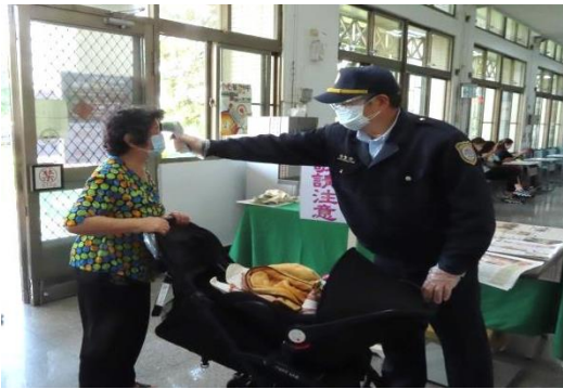
戒護人員主動協助家屬