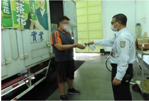
送貨廠商需配合量體溫、消毒、換口罩