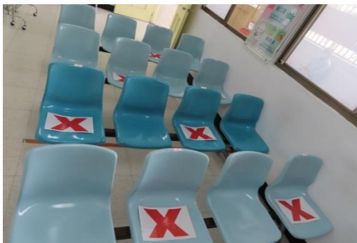
室內候診區做看診前的座位分流