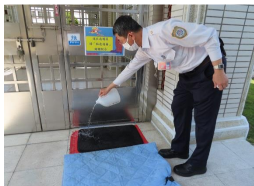
固定澆灑漂白水在設置的消毒墊上