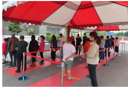
家屬盡量都能保持距離等待排隊