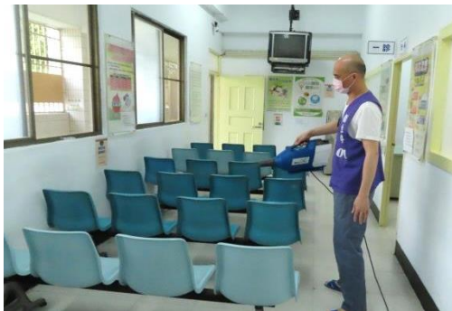
候診室做看診前、看診後的消毒