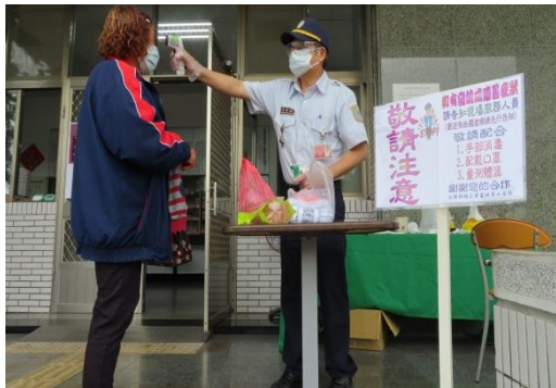
家屬進出需消毒、量體溫、戴好口罩