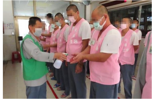
伙食配送人員進出中央台均需消毒