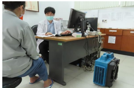
診間增設放置~空氣清淨機