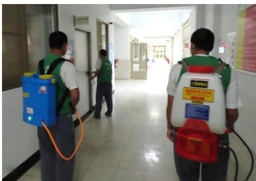
全監固定時間早晚做清潔消毒