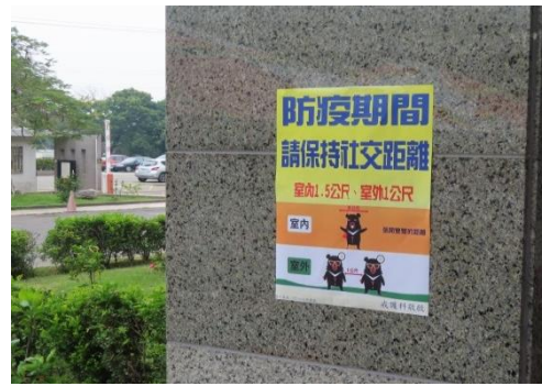
接見中心等待區外牆上處處有海報提醒家屬宣導防疫