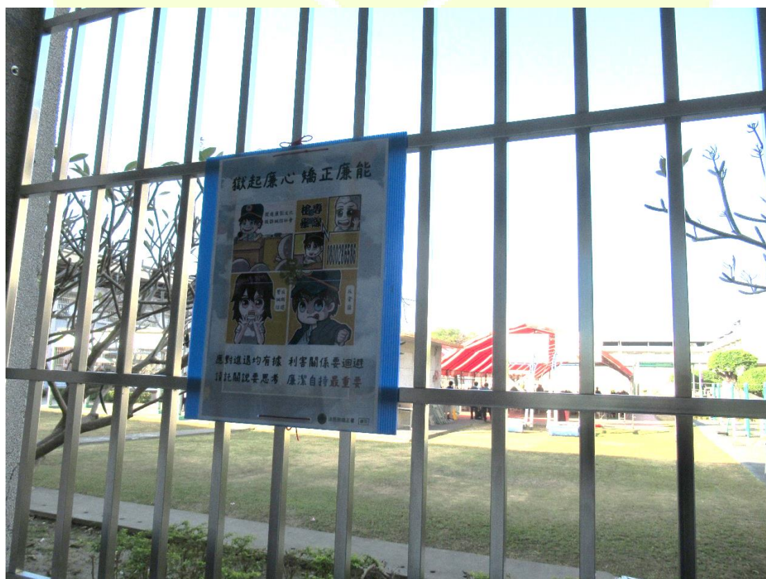
圖四、雲林監獄於會場周邊懸掛Q版廉政貼圖海報