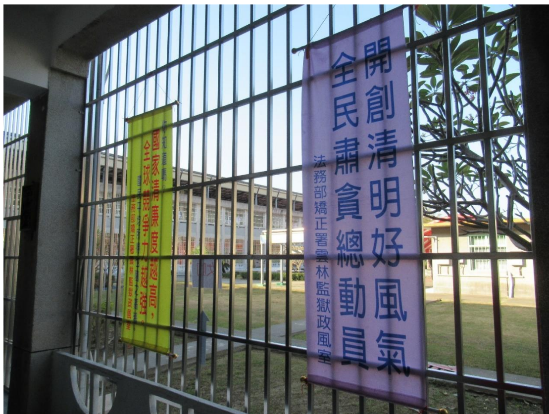
圖三、雲林監獄於會場周邊懸掛廉政宣導布條