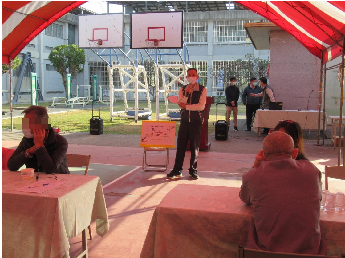
圖一、雲林監獄政風室向收容人家屬辦理廉政宣導