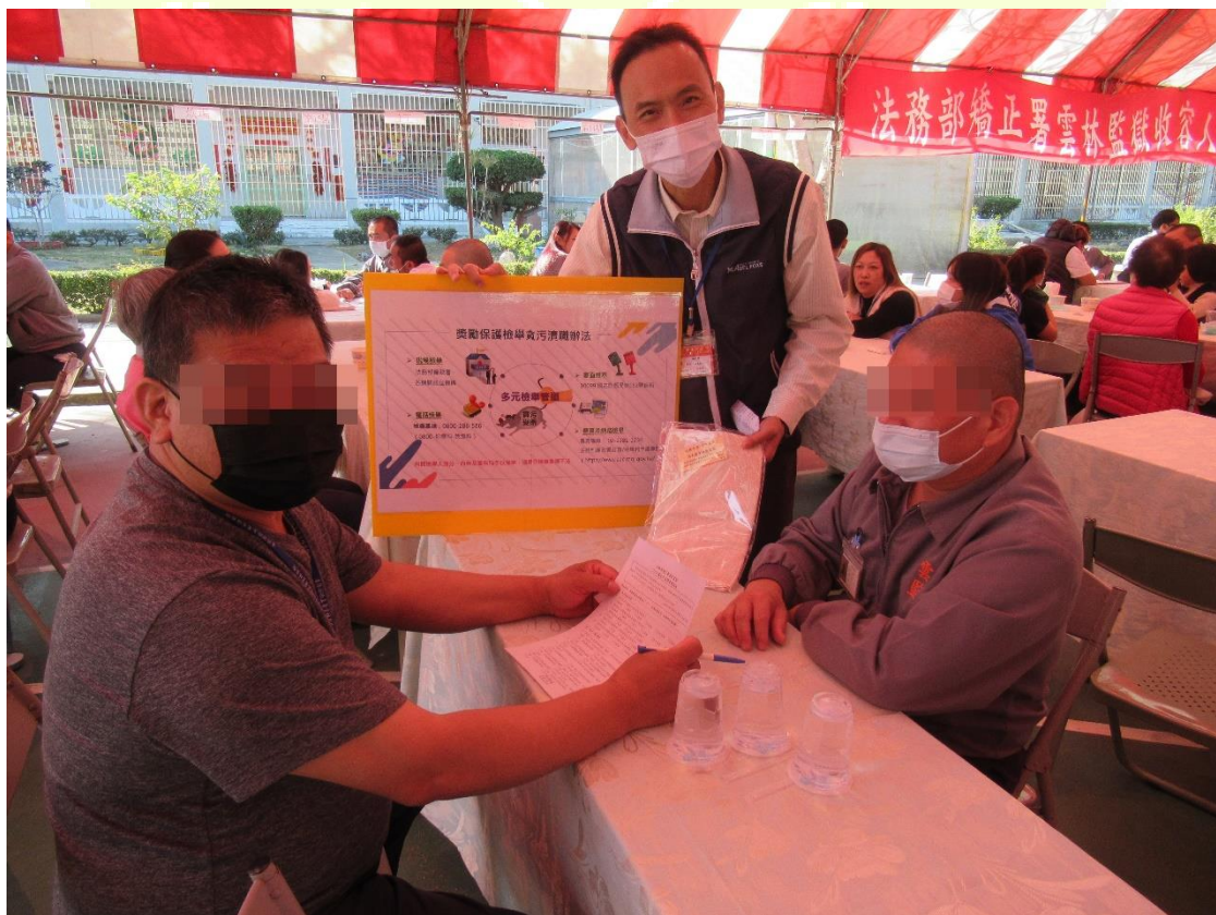
圖二、雲林監獄政風室致贈家屬本監自營作業無染毛巾，並辦理廉政宣導